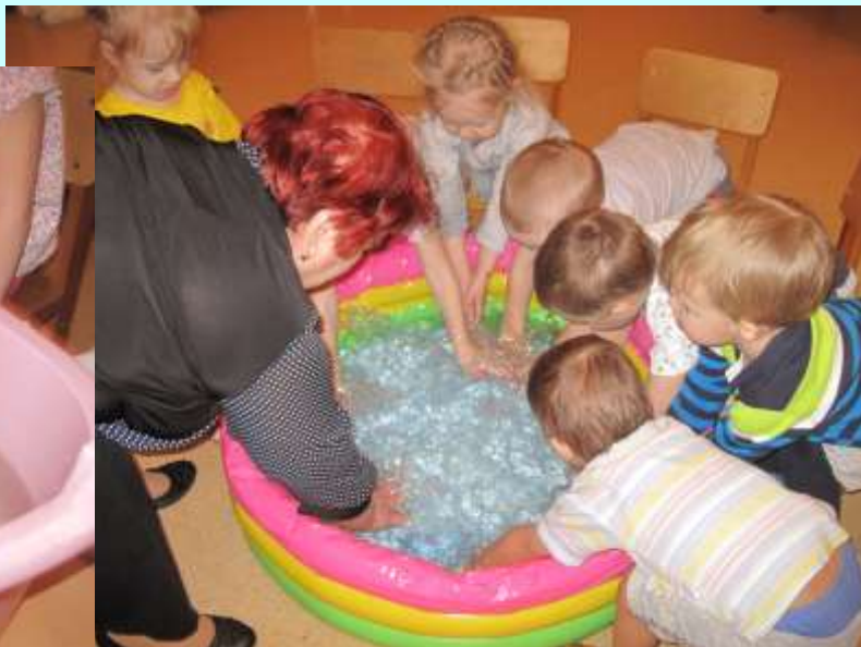
Получилась мыльная пенка

«Рыбка, рыбка, озорница, Мы хотим тебя поймать».