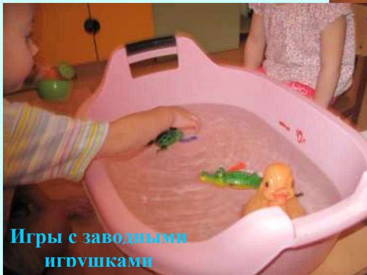
Игры с заводными игрушками